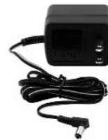
120 VOLT AC CHARGING ADAPTER

Make sure all other unit functions are turned OFF during recharging, as this can slow the recharging process.